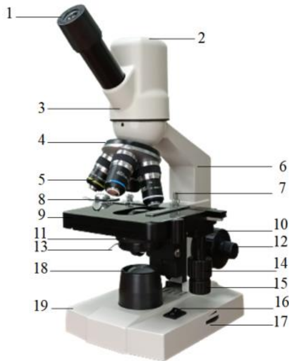
Hình 1. Cấu tạo kính hiển vi DMK10A