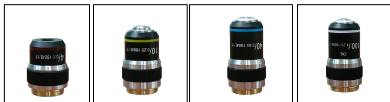
Hình 3. Vật kính 4X, 10X, 40X, 100X (từ trái sang phải)